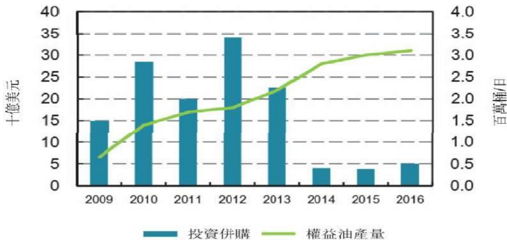
圖 3 中國大陸石油產業海外併購與權益油產量，2009～2016